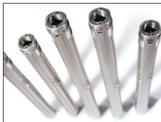
Помпа SQ с кабел 1,5 m

SQ - Потопяеми помпи за тесни сондажи 3", с корпус и двигател от неръждаема стомана и вградена защита от суха работа Плавен пуск; Вграден възвратен клапан; Диаметър на помпата Ф 76 mm