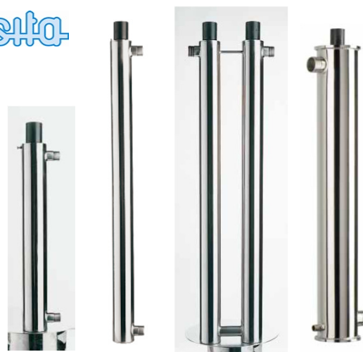
UV 405 UV 412 UV 450 UV 440-480