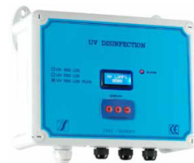
Панел 450-550 - 550 Plus