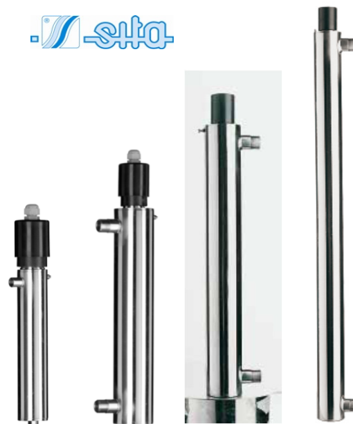
UV 107 AL UV 403 AL UV 405 AL UV 412 AL