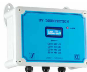
Панел 405-412-440-480 LCD

UV 405/412/440 - 200x160x90 mm UV 450 - 200x160x90 mm UV 480 - 200x160x90 mm UV 550, 80/2 - 240x190x90 mm