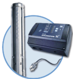
Помпа SQE с кабел 1,5 m

Помпите SQE да се комплектват с CU301 или пакет за постоянно налягане!