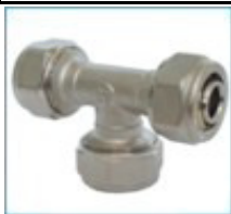
ART. 7256 - Тройник тристранен