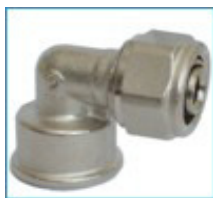
ART. 7254 - Коляно с вътрешна резба