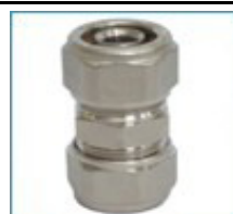
ART. 7252 - Права връзка междинна