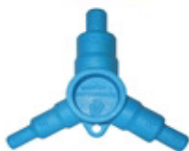
ART. 7275 - КАЛИБРАТОР