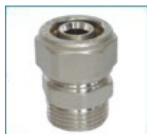
ART. 7250 - Права връзка с М резба