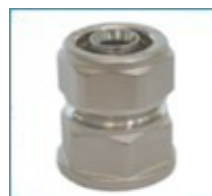
ART. 7251 - Права връзка с F резба