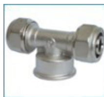
ART. 7257 - Тройник с вътрешна резба