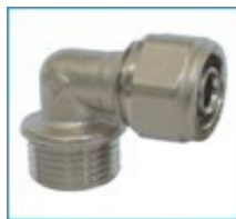
ART. 7255 - Коляно с външна резба