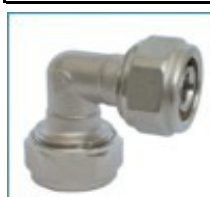
ART. 7253 - Коляно междинно